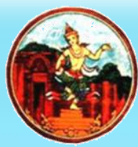
บุรีรัมย์