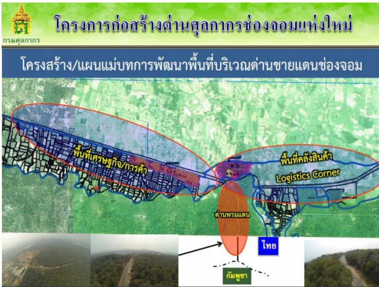
มติที่ประชุม