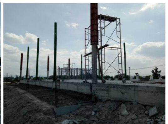
อาคารจำหน่ายของที่ระลึก(DC03) กำลังดำเนินงานโครงสร้าง