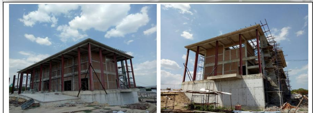
อาคารศูนย์พักพิงสุนัข(DC01) แล้วเสร็จงานโครงสร้างทั้งหมด กำลังดำเนินงานตกแต่งด้านสถาปัตยกรรม