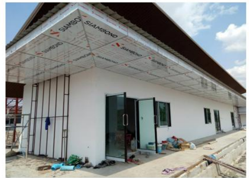
อาคารคลินิก(DC05),แผนกช่าง(DC06),อาคารเก็บอาหารสัตว์(DC07) งานโครงสร้างทั้งหมดแล้วเสร็จ กำลังดำเนินงานตกแต่งด้านสถาปัตยกรรม