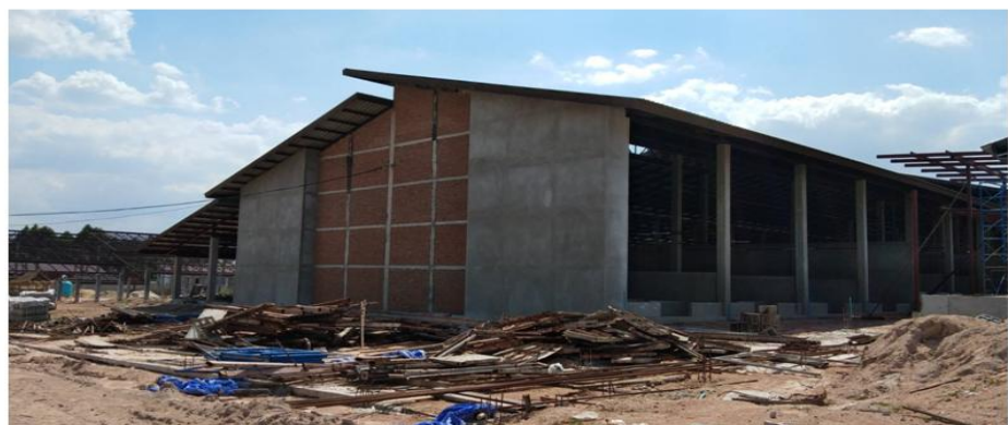
อาคารพักพิงสุนัข-ค้าย้าย(DC08) งานโครงสร้างทั้งหมดแล้วเสร็จ กำลังดำเนินงานตกแต่งด้านสถาปัตยกรรม