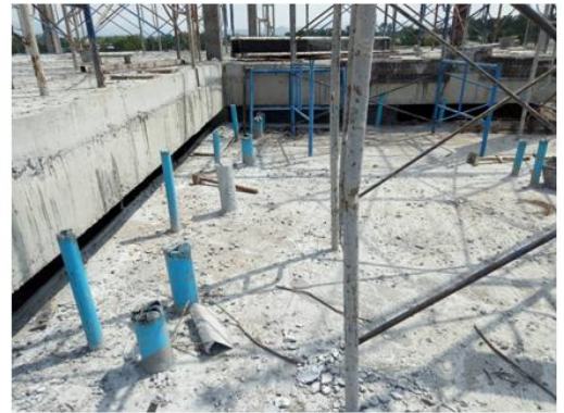
อาคารจำหน่ายอาหาร(DC02) กำลังดำเนินงานโครงสร้าง