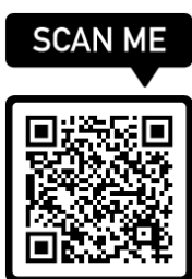
ตัวอย่างเล่มปีที่แล้ว

อย่างปึงบประมาณที่ผ่านมาเราได้ส่งเล่มเพื่อประชาสัมพันธ์ประมาณช่วงเดือนมีนาคม ๒๕๖๔ แต่เนื่องด้วยปีที่ผ่านมามา ทางกลุ่มจังหวัดได้ลงพื้นที่เก็บข้อมูลด้วยตัวเอง จัดทำเอกสารรวบรวมทำรูปเล่มเอง จึงจะแตกต่างจากปีที่เราจะให้ทั้ง ๔ จังหวัด ส่งข้อมูลเข้ามาและเราจะเข้ามาพิจารณาในที่ประชุม แล้วรวบรวมเป็นรูปเล่ม ซึ่งจะมีโครงการที่ยังดำเนินการไม่แล้วเสร็จอยู่หลายรายการที่จะต้องรอโครงการทุกโครงการเบิกจ่ายให้เสร็จก่อน จะมีตัวอย่างเล่มในปีก่อนๆ ให้ดูนะค่ะ