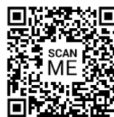
ตัวอย่างเล่มลงพื้นที่ปีที่แล้ว