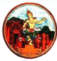
บุรีรัมย์