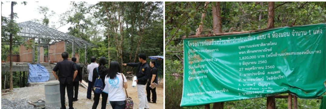
ก่อสร้างบ้านพักนักท่องเที่ยว