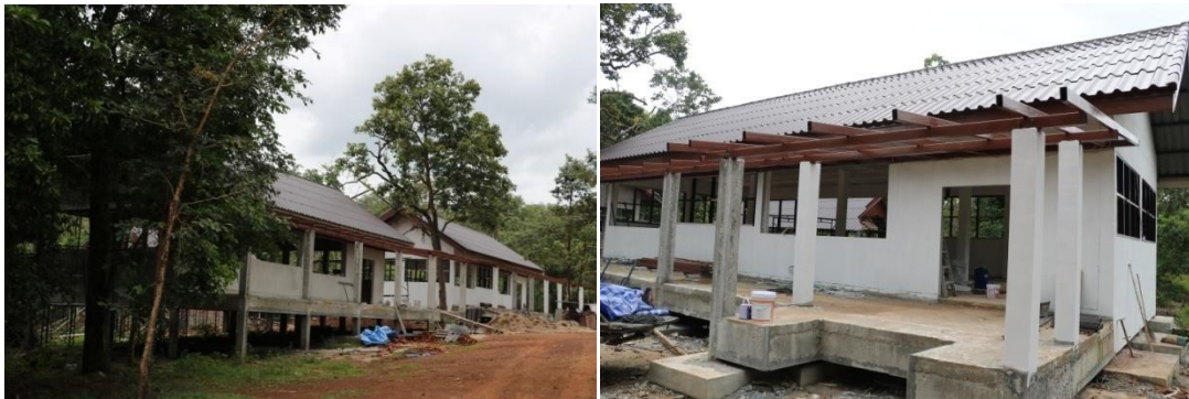
ก่อสร้างอาคารค่ายเยาวชน ขนาด 40 คน