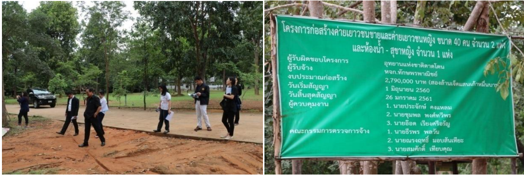
ก่อสร้างอาคารค่ายเยาวชน ขนาด 40 คน