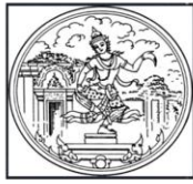
บุรีรัมย์