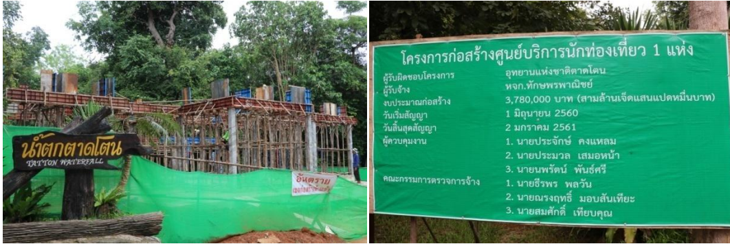
ก่อสร้างอาคารศูนย์บริการนักท่องเที่ยว