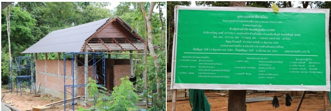
ก่อสร้างห้องน้ำ-ห้องสุขาหญิง