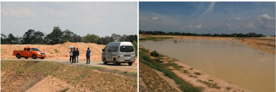
ตรวจติดตามการดำเนินโครงการที่บึงกระเสียว