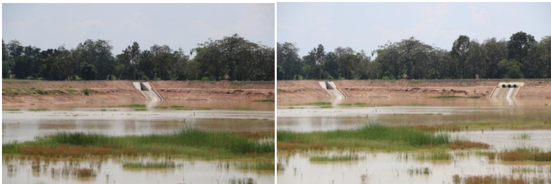
ระบบเชื่อมโยงน้ำซึ่งรับน้ำจากบึงกระเสียวมาเติมบึงพิมาน