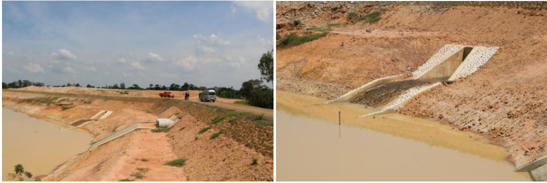
ระบบเชื่อมโยงน้ำซึ่งรับน้ำจากบึงบ้านเขว้ามาเติมบึงกระเสียว