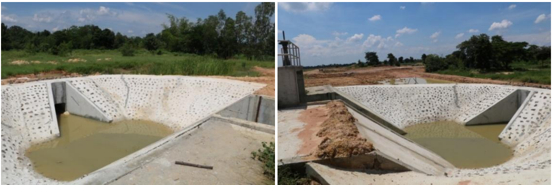
ช่องรับน้ำของระบบเชื่อมโยงน้ำ เพื่อผันน้ำจากบึงบ้านเขว้าไปเติมที่บึงกระเสียว