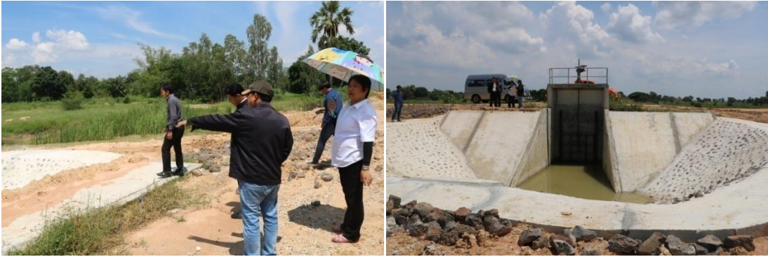
ประตูระบายน้ำบึงบ้านเขว้า