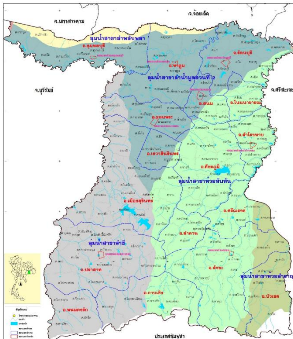
แสดงขอบเขตการปกครองและลุ่มน้ำสาขาในพื้นที่จังหวัดสุรินทร์