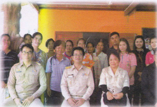
กลุ่มท่อผ้าไหมบ้านปราสาท หมู่ที่ ๑๔ อำเภอกาบเชิง จังหวัดสุรินทร์