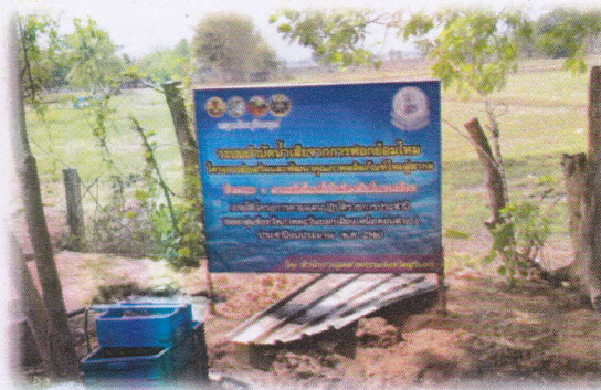
กลุ่มทอผ้าไหมบ้านด่านเจริญ ตำบลกระเทียม อำเภอสังขะ จังหวัดสุรินทร์