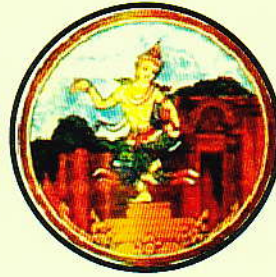
บุรีรัมย์