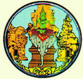
สุรินทร์