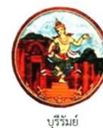
บุรีรัมย์