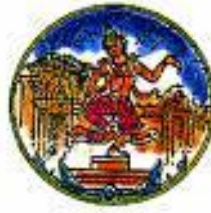
(บุรีรัมย์)