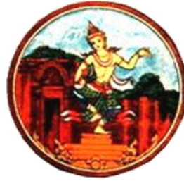
บุรีรัมย์