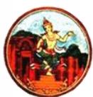
บุรีรัมย์