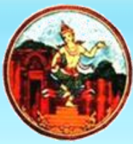
บุรีรัมย์