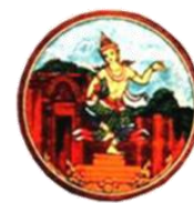
บุรีรัมย์